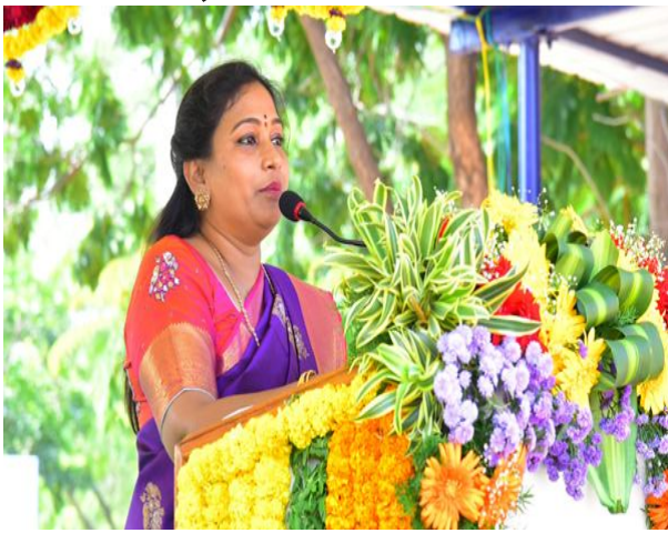
గత తప్పులను సరిదిద్దుతున్నాం : డిజిపి

శాంతిభద్రతల రక్షణ విషయంలో గత ఐదేళ్లలో కొన్ని తప్పులు జరిగాయని, ప్రస్తుతం వాటిని సరిదిద్దడంపై దృష్టిపెట్టమని డిజిపి ద్వారాకా తిరుమలరావు తెలిపారు. తాము రాజ్యాంగానికి కట్టుబడి పనిచేస్తామని, రాజకీయ ఒత్తిళ్లలో పనిచేయబోమని స్పష్టం చేశారు. ఓ పార్టీ కార్యాలయంపై దాడి జరిగినప్పటికీ బాధ్యతగా వ్యవహరించలేదని, ఈ ఘటనపై మూడేళ్ల తర్వాత చర్యలు తీసుకోవడం ఏమిటని కొందరు ప్రశ్నించడం సరికాదన్నారు. తప్పు జరిగితే 30 ఏళ్ల తర్వాత కూడా చర్యలు తీసుకోవచ్చని స్పష్టం చేశారు. కేరళలో తప్పు జరిగిన 20 ఏళ్ల తర్వాత ఓ ఐపిఎస్కు శిక్ష విధించారని తెలిపారు. ఫింగర్ ప్రింట్ టెక్నాలజీ ఉన్నప్పటికీ గత ప్రభుత్వం వినియోగించలేదన్నారు. మానవ హక్కులు, మహిళలు, చిన్నారుల రక్షణకు ప్రథమ ప్రాధాన్యం ఇస్తున్నామని చెప్పారు. ఐజి సంజరుపై వచ్చిన ఆరోపణలపైనా విచారణ జరుగుతోందని చెప్పారు. ఆయనపై విచారణ నివేదిక జిఎడికి వెళ్లిన తర్వాత తమకు వస్తుందని తెలిపారు.