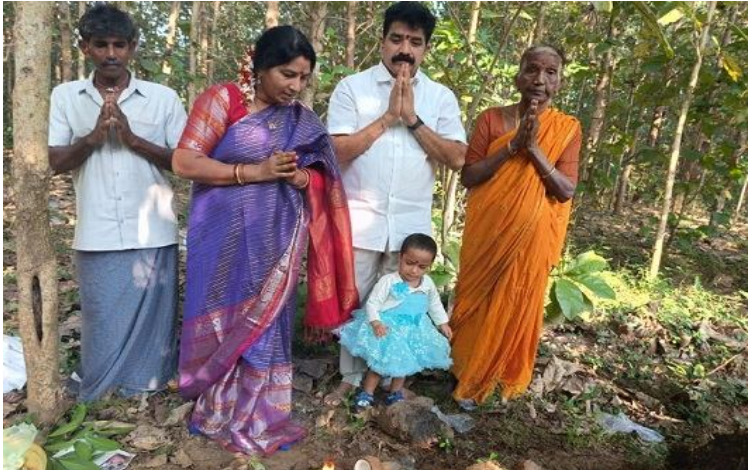
చోడవరం పెన్ సత్తా నవంబర్: చోడవరం పట్టణంలోని, మండలంలోని అన్ని గ్రామాల్లో నాగుల చవితి వేడుకలు భక్తిశ్రద్ధలతో ఘనంగా జరుపుకున్నారు. సాంప్రదాయమైన దుస్తులు ధరించి నాగేంద్రుని పుట్టల వద్దకు వెళ్లి పూజలు జరిపి