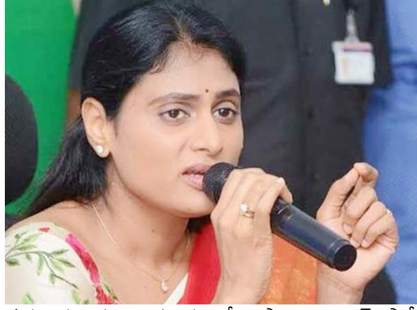
గురువారం నుంచి మూడు రోజులపాటు కాంగ్రెస్ పార్టీ ఆధ్వర్యం నాగ్రామ వ్యాప్తంగా నిరసన కార్యక్రమాలకు పిలుపునిచ్చినట్లు చెప్పారు.

అమరావతి: విద్యుత్ సర్దుబాటు ఛార్జీల విషయంలో గత ప్రభుత్వం చేసిన పాపాలకు ప్రాయశ్చిత్తం చేయాల్సిందిపోయి, కూటమి ప్రభుత్వం ఆ పాప పరిహారాన్ని ప్రజల నెత్తిన మోపుతోందని పిసిసి అధ్యక్షులు వైఎస్ షర్మిల పేర్కొన్నారు. రూ.18 వేల కోట్లు సర్దుబాటు ఛార్జీలు వినియోగదారుల నెత్తిన వేయడం కూటమి ప్రభుత్వం ప్రజలకు ఇస్తున్న భారీ 'కరెంట్ షాక్' అని విడుదల చేసిన ప్రకటనలో పేర్కొన్నారు. గత ప్రభుత్వ అనాలిచిత నిర్ణయాలకు ప్రజలను ఎలా బాధ్యులను చేస్తారని ప్రశ్నించారు. ఐదేళ్లలో వైసిపి రూ.35 వేల కోట్లు భారం వేస్తే, ఐదు నెలల్లో కూటమి ప్రభుత్వం రూ.18 వేల కోట్ల భారం వేస్తుందన్నారు. ఎన్నికల్లో ఇచ్చిన హామీకి కట్టుబడి సర్దుబాటు ఛార్జీల భారం వినియోగదారులపై వేయకుండా ప్రభుత్వమే భరించాలని డిమాండ్ చేశారు. విద్యుత్ ఛార్జీల పెంపునకు వ్యతిరేకంగా