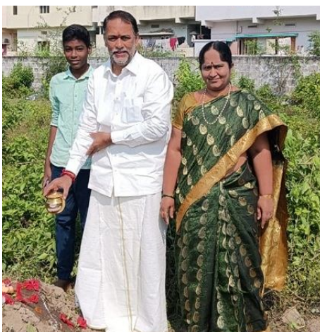
పాలు పోసి తమ తమ మొక్కలు చెల్లించుకున్నారు. స్థానిక ఎమ్మెల్యే కే.ఎస్.ఎస్.ఎస్. రాజు చోడవరంలోని, మాజీ ఎమ్మెల్యే కరణం ధర్మశ్రీ వంటర్లపాలెం గ్రామంలోని కుటుంబ సభ్యులతో కలిసి నాగేంద్రునికి పూజలు జరిపి పాలు పోశారు.